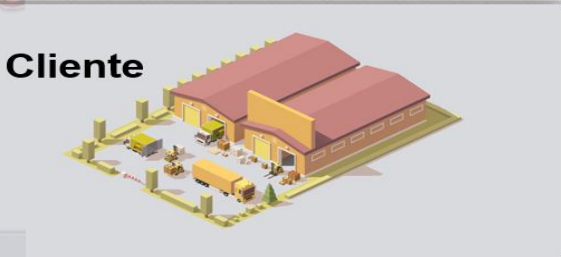
Ilustração da operação

Através dos canais : site , aplicativo , e-mails, rastreamento dos veículos e por entrega individual , telefones sempre estabelecendo relacionamento de amizade com nossos clientes e parceiros.